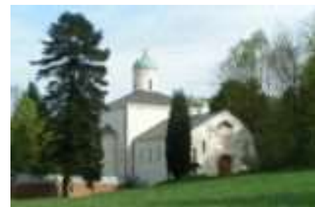
De Byzantijnse Kerk

De monniken bemoeien zich niet of nauwelijks met de gasten, maar je moet als gast wel aanpassen aan hun gewoontes, bv niet praten onder het eten, ook al zaten we in een aparte ruimte en stilte na 10