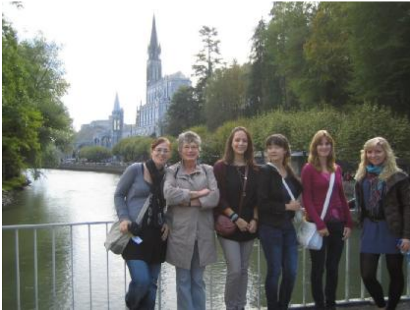
De dames apart op een foto.