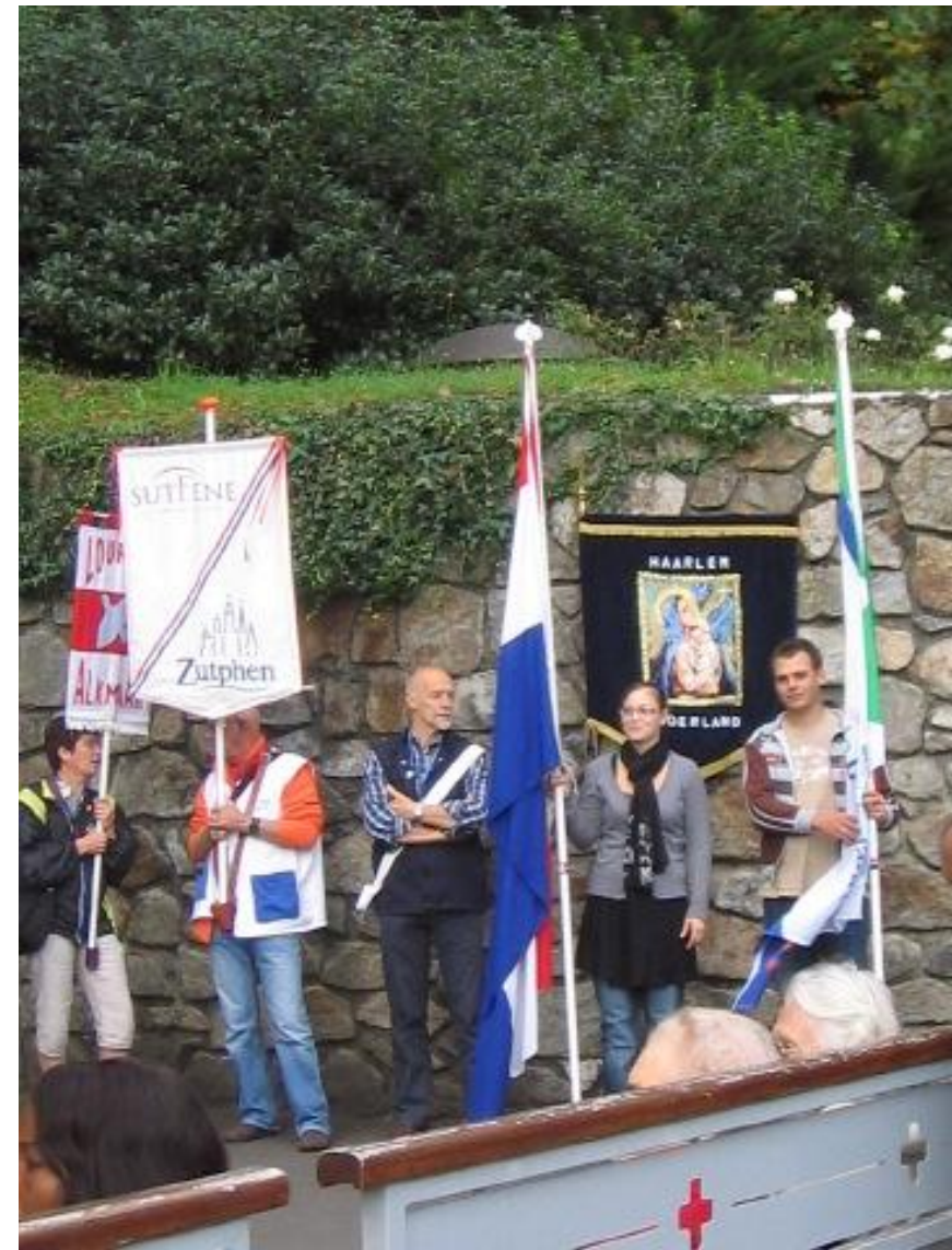
Ouderkerk presenteert zich in Lourdes als vlaggendragers