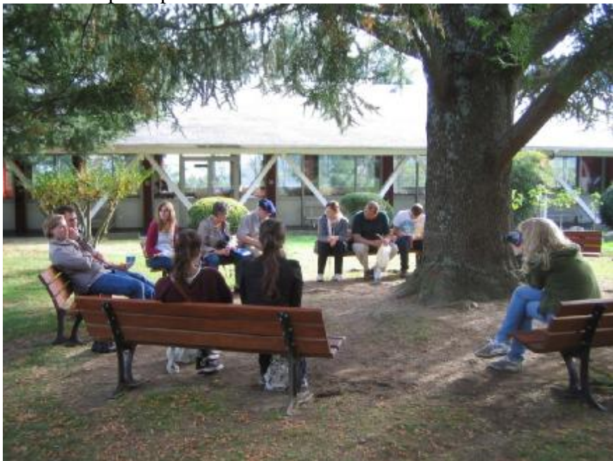
Een ontspannen evalueren in Cité de Saint Pierre