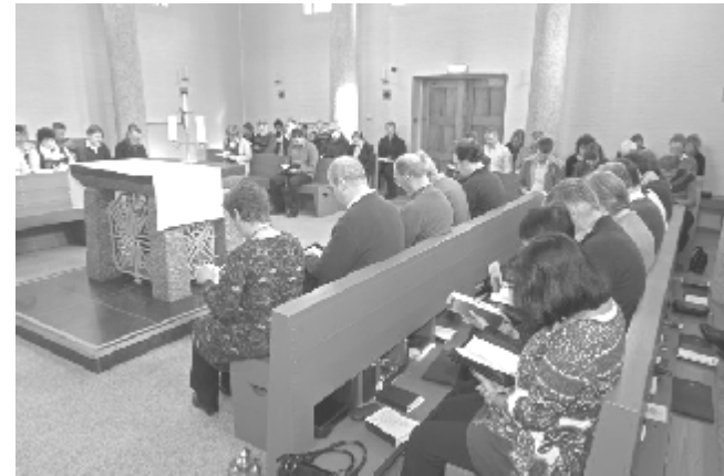
Gezamenlijk gebed in de kapel van De Tiltenberg

Je bent van harte welkom op deze open dag!