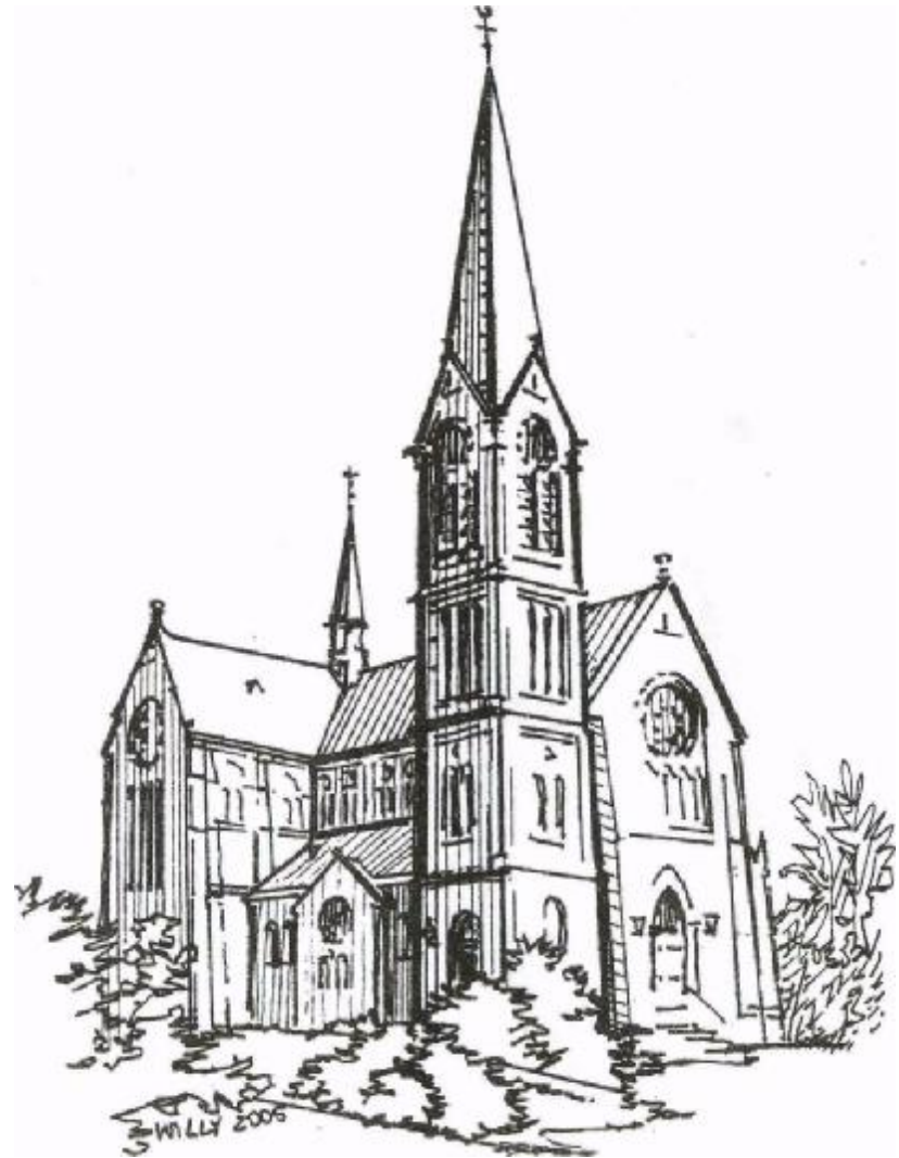
parochieblad st. urbanus ouderkerk aan de amstel juli/augustus 2006