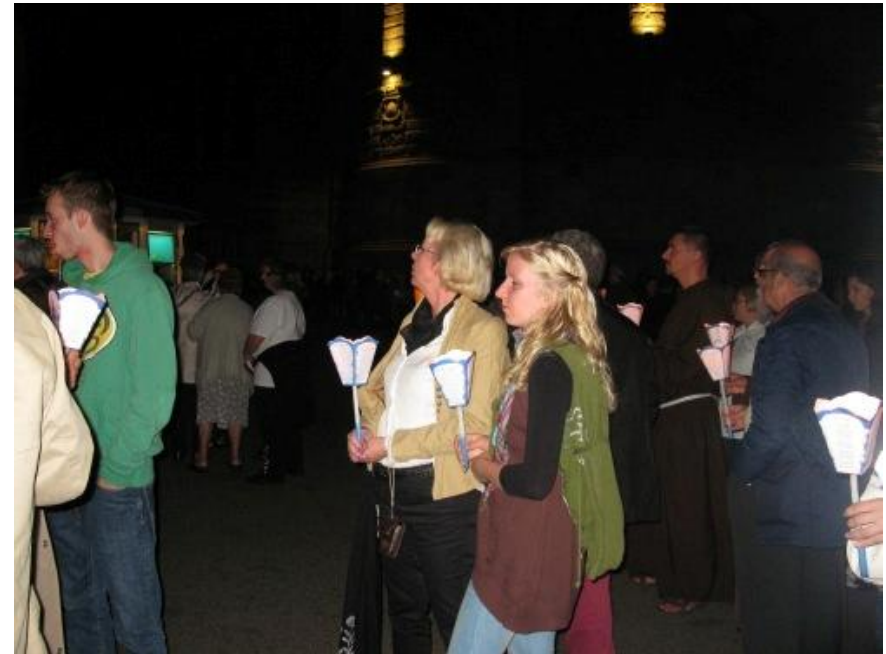
Gezamenlijk de lichtprocessie lopen, verbondenheid ervaren door gebed en saamhorigheid.