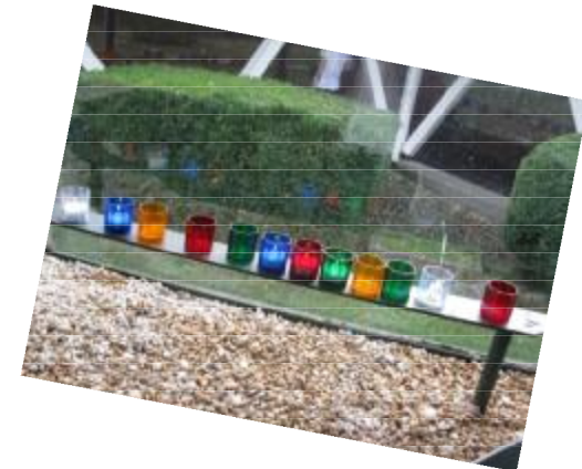
De kaarsjes die we hebben opgestoken in Cité de St. Pierre. Kaarsjes voor de vrede: licht dat we in Nederland verder mochten doorgeven.