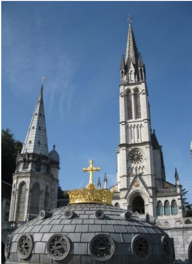
De 'bekroonde' koepel van de kerk op het heiligdom.